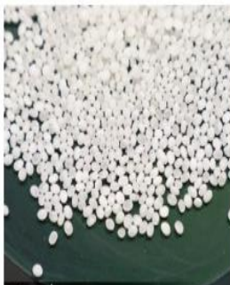
精米 | 丁寧に米を磨く

酒造りの現場には、常に、緊張感と共に神聖な空気が漂います。いくつもの複雑な工程を経て完成する新潟清酒。それは米と水、酵母や麹菌といった自然界の力と、匠の技とが生み出す芸術作品と呼ぶべき存在です。