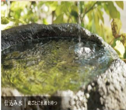
仕込み水 | 蔵ごとに水源を持つ