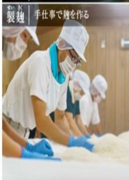
製麹 | 手仕事で麹を作る