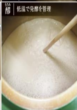
醸 | 低温で発酵を管理