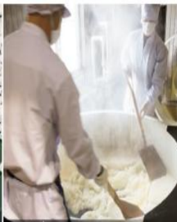
蒸米 | 酒米を蒸す