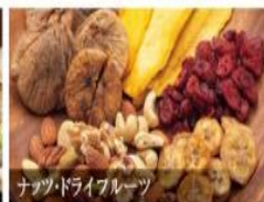
ナッツ・ドライフルーツ